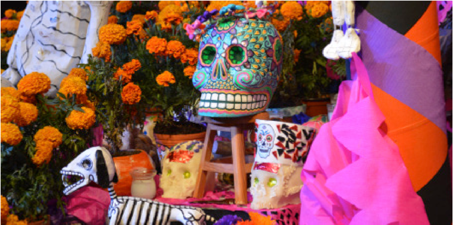
Day of the Dead Altar, Mexico. Photo by Paola Ricaurte Quijano This file is licensed under the Creative Commons Attribution-Share Alike 4.0 International license.

Llegan a reverdecer, llegan a abrir sus corolas nuestros corazones;