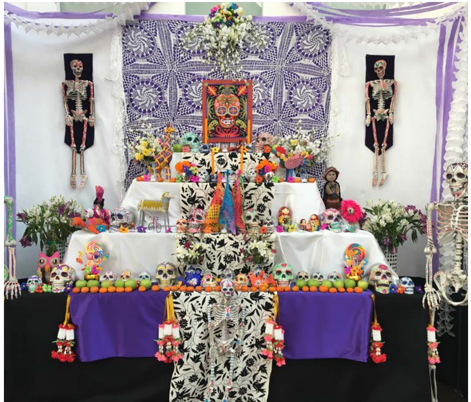
Día de los Muertos Angelitos Altar, Museum of International Folk Art, 2017