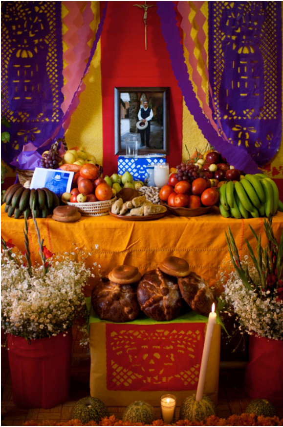
Traditional Day of the Dead altar, Milpa Alta, Mexico. Photo by Eneas de Troys, 2009. This file is licensed under the Creative Commons Attribution 2.0 Generic license.