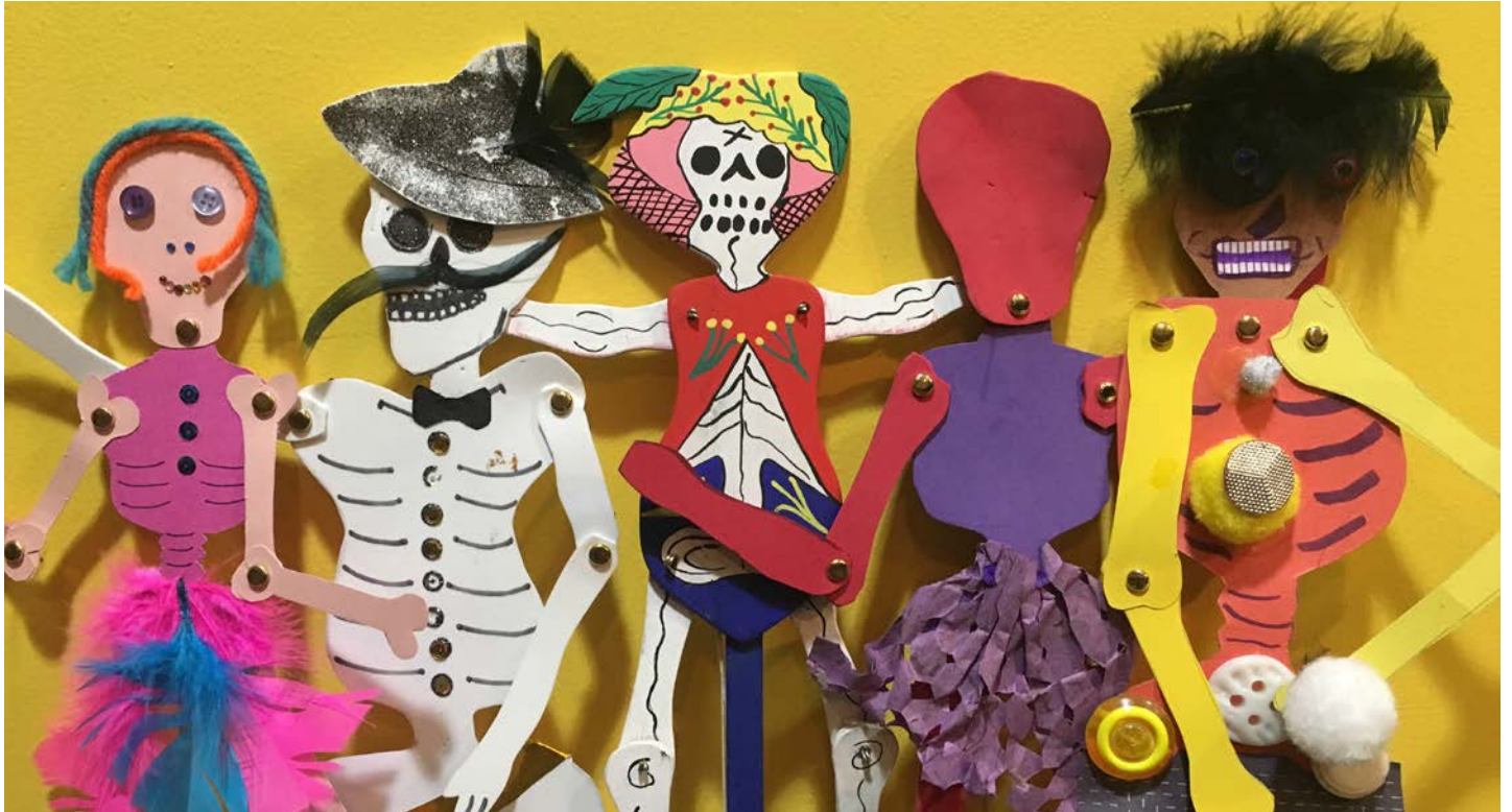
Skeleton Esqueleto Puppets, Hands-on studio, Museum of International Folk Art, 2019.