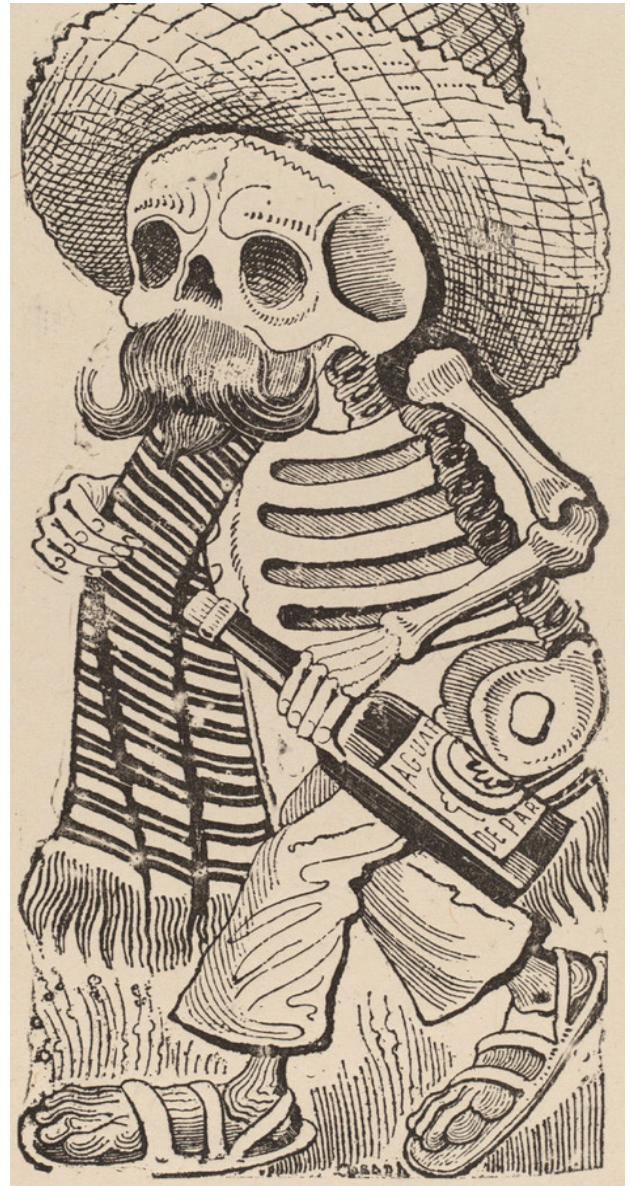
Images by José Guadalupe Posada La Calavera Catrina (The Skeleton of a Fashionable Lady) & Calavera Maderista (Skeleton of a follower of President Madero), 1913, National Gallery of Art, Washington, DC, 144.5.130.

La capital Azteca de México-Tenochtitlan cayó el 13 de agosto de 1521 y la destrucción sistemática, la expulsión, la explotación y el exterminio de la población indígena comenzó. Con el permiso divino de la Iglesia Católica Romana y la Corona española, el clero evangelizador procedió a borrar todos los rastros de los sistemas de creencias de los nativos. Pirámides, templos, códices (libros ilustrados) fueron destruidos y profanados.