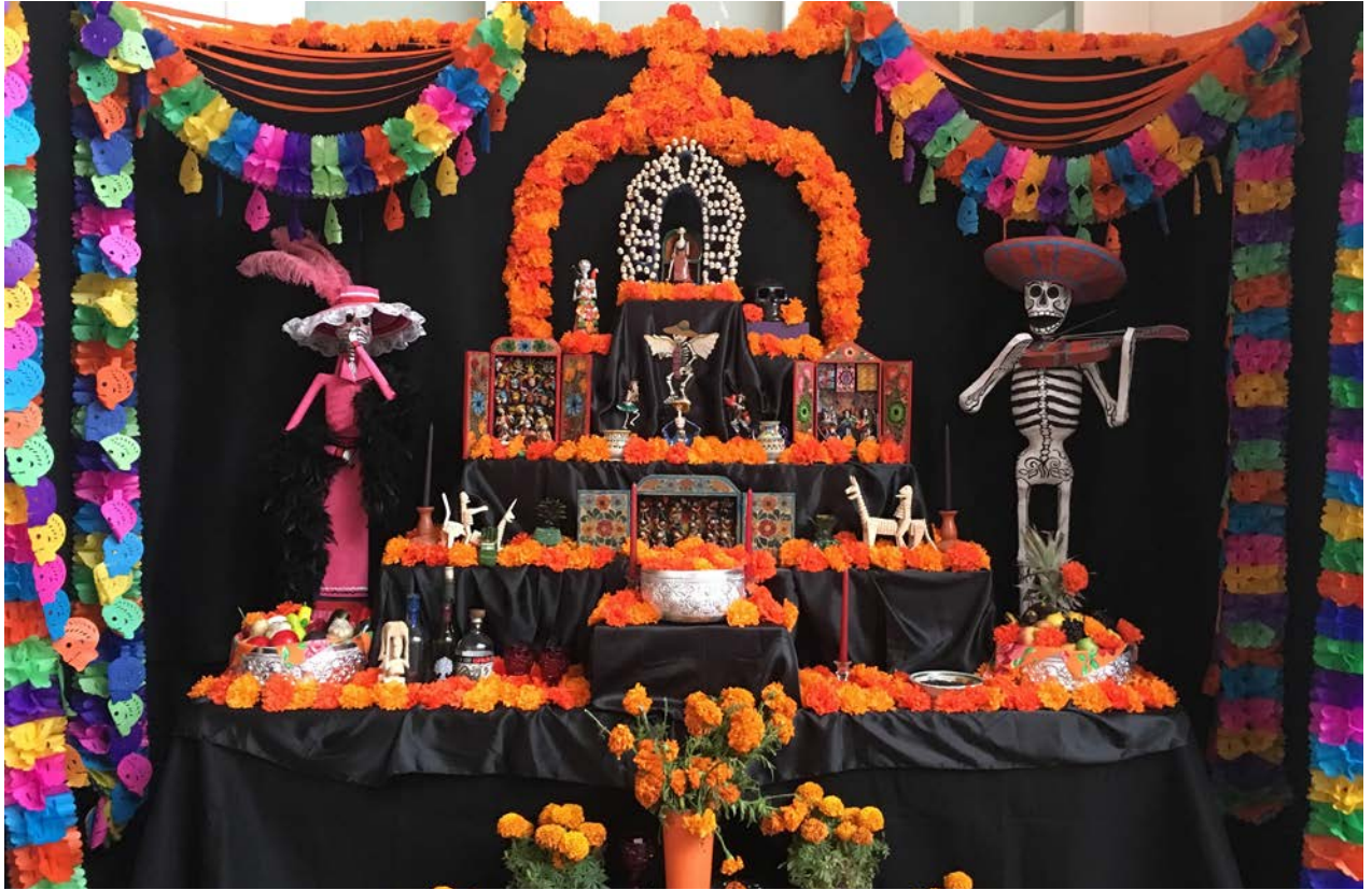
Día de los Muertos Altar, Museum of International Folk Art, 2017.

Finalmente, muchas de las creencias españolas llegaron a coexistir con las creencias indígenas, ya que numerosos santos católicos se unieron a la jerarquía de los dioses. Después de la conquista, la conversión masiva de los Mexica-Azteca y otros pueblos nativos al catolicismo se facilitó al combinar los sitios y ceremonias de la cultura indígena con las tradiciones europeas.